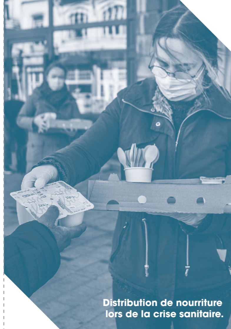
Distribution de nourriture lors de la crise sanitaire.

Depuis la création de L'Ilot, des centaines de personnes ont ainsi pu retrouver un chez-soi et s'y installer avec l'aide de nos équipes.